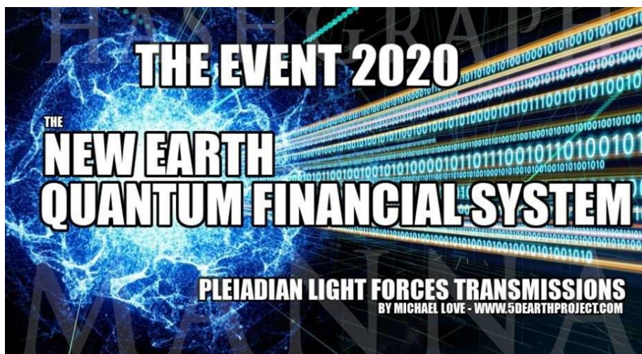
Das Quantum Financial System QFS soll von den Plejaden stammen (Cobra).

Die Quantentechnologie soll von wohlwollenden außerirdischen Kräften bereitgestellt worden sein. Der Zweck des neuen Finanzsystems ist es, der "kabalen Korruption" (Kabale = intrigante Machtelite, die Red.), dem Wucher und der Manipulation innerhalb der Bankenwelt ein Ende zu setzen. Der Schlüssel ist die Implementierung von Beschränkungen, die verhindern, dass korrupte Banker signifikante Gewinne erzielen.