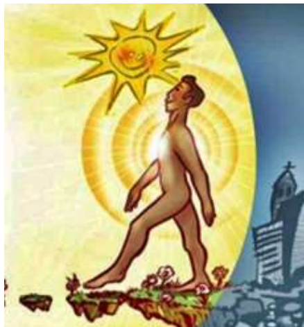
Der Mensch unterwegs zu neuen Welten.

Wir seien geschult darin, an Grenzen, an Under-Unity, an Entropie zu glauben. In aktueller Zeit kollabiere dieses System - es sei der Übergang von Under-Unity zur Over-Unity - nicht nur in der Technik, sondern auch im Bewusstsein - , von der Begrenztheit zum Grenzenlosen, von der Entropie zur Syntropie. Freie-Energie-Systeme hätten nur dann eine Chance zur Realisierung, wenn Erfinder ihre erste Aufgabe darin sehen würden, der Menschheit zu dienen und nicht dem Geld. Dieses komme dann von allein. Mit alten Entropiesystemen werde die Menschheit untergehen. Ein Durchbruch sei aber möglich, wenn alle Mitglieder einer Kette - vom Erfinder über