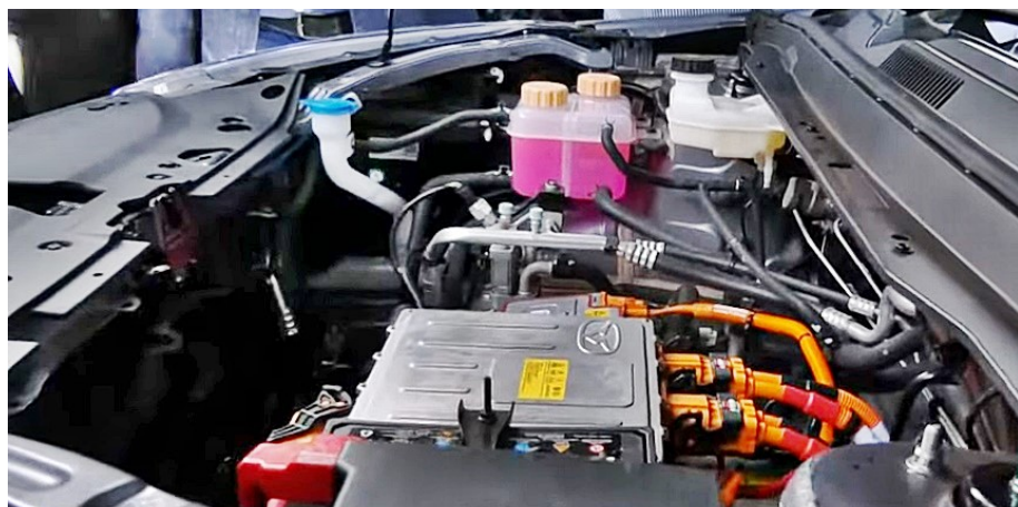
Blick in das Innere des “free energy cars”, dessen Kofferteil sich zerstört, sobald er geöffnet wird. Das ist die Art, wie Maxwell seine Erfindung schützt, weil er kein Patent anmelden kann.

so minim sind, dass sie gar nicht zur Energieerzeugung mobiler und stationärer Geräte herhalten können.