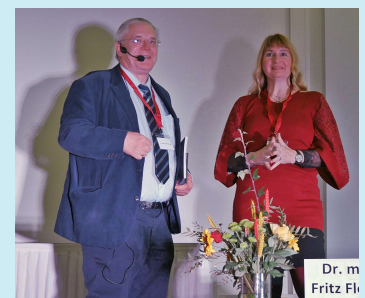
Dr. m Fritz Fl.