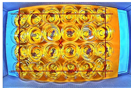
Zum Bild schreibt Dr. Fritz Florian: "Unerklärliche, mysteriöse, ultralangsame Samenpulsationen oder Samenrotationen auf Wasser oder Speise-Öl. Nachweis der Existenz einer unbekanntener, mysteriösen 'Freie-Energie-Form'. Rotierende und pulsierende Sameninseln suchen in dieser Weise das rettende Ufer."