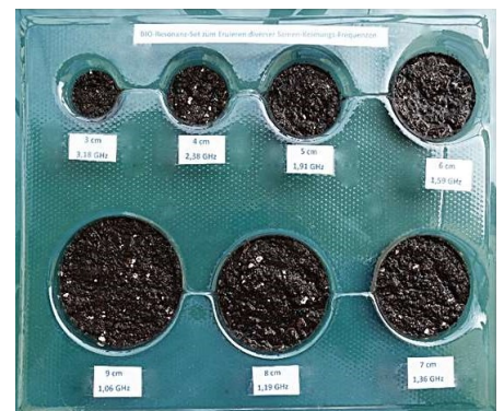
Dieses KeimMi Pro Bioresonanz-Keimungs- und Wachstums-Set, das zusätzlich zum Buch erworben werden kann, bietet die besten Behältergrößen und Anleitungen für rasches Gedeihen.

Damit kann jeder Leser und jede Leserin sehr leicht die faszinierenden Wachstumsexperimente selber durchführen. Das Set enthält ausserdem 13 Lernvideos auf einer SD-Speicherkarte für üppigere Obst- und Wein-Ernten mit vielen Zeitraffer-Videos, allen Studienergebnissen und zusätzlichen Infos.