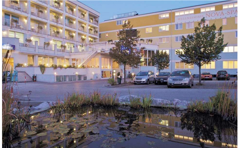
Das Hotel Novapark: bequem, grosszügig gestaltet, mit Teichen und Grünflächen und einer grossen Wellnessoase.

Täglich bietet die Deutsche Bahn mindestens zwei Direktverbindungen im Fernverkehr (mit EC) nach Graz: - von Saarbrücken direkt nach Graz; - von Frankfurt direkt nach Graz; - es gibt weitere Direktverbindungen aus Darmstadt, Mannheim, Heidelberg, Stuttgart, Ulm, Augsburg, München.