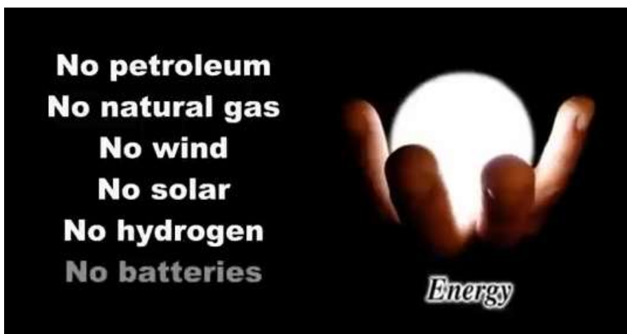
Das verspricht WITTS: Technologien ohne Öl, Erdgas, Wind, Solar, Wasserstoff und Batterien.