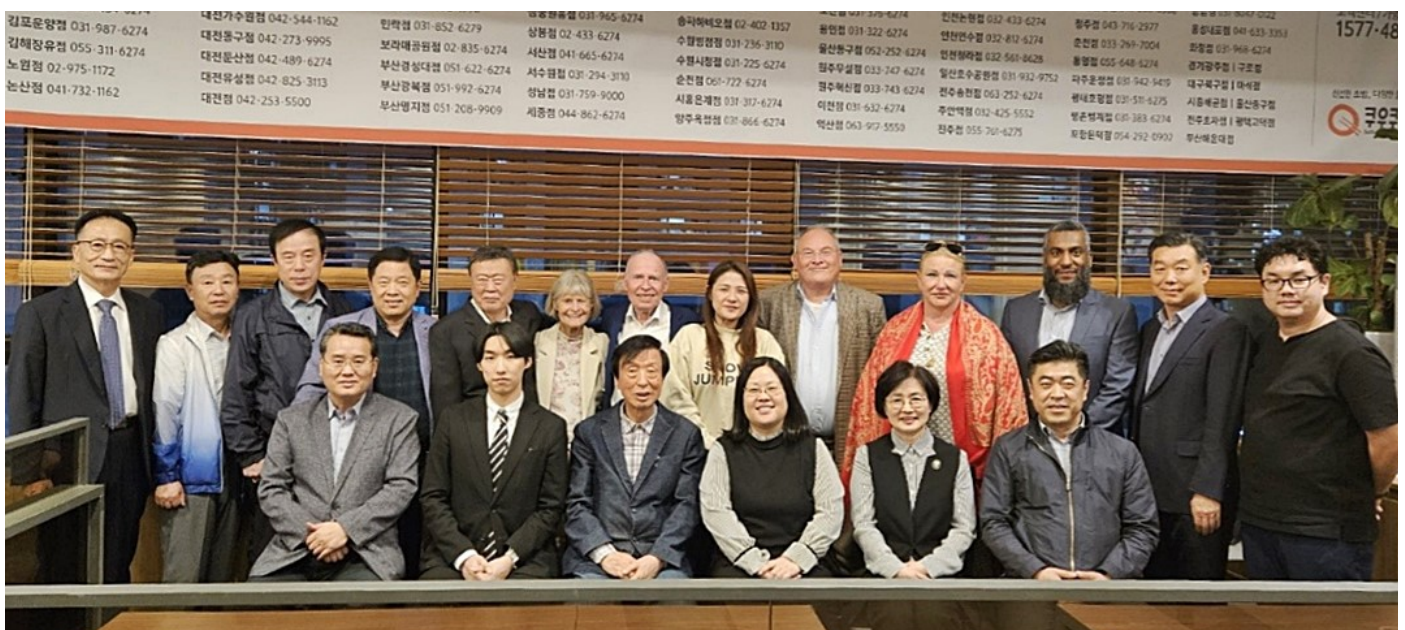
Schlussfoto des SEMP-Teams aus Südkorea mit der Delegation aus Deutschland, der Schweiz und UAE, nachdem eine Vereinbarung zum weiteren Vorgehen gefunden wurde.

Achtung: SEMP an der Tagung: Das Team aus Deutschland und der Schweiz stellt die Resultate ihres SEMP-Besuchs mit Filmen, Auswertungen usw. an der Tagung vom 30. November in Zürich vor (Programm ab Seite 26).